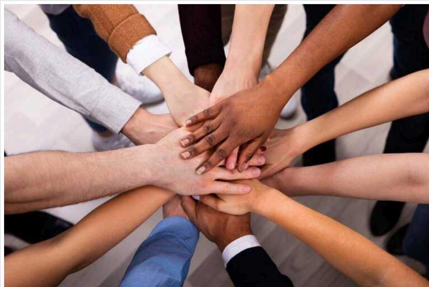
У США темношкірим «зливали» ключові слова для резюме, щоб поставити їхні кандидатури у пріоритет

Авіаційне управління США надало темношкірим претендентам ключові слова для резюме, щоб забезпечити їхнім кандидатурам пріоритетну увагу.