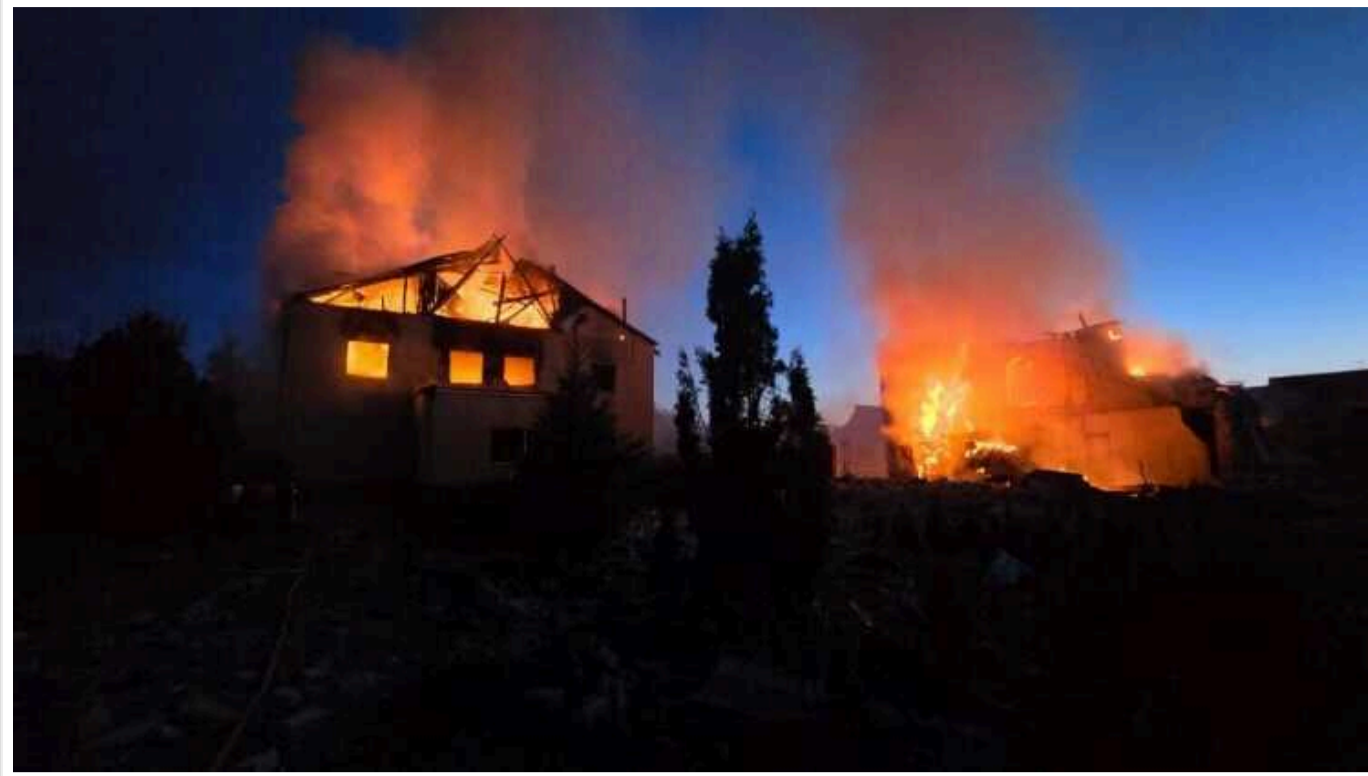
Окупанти вдарили по Ізюму: повідомляють про 12 постраждалих

У Харківській області російські війська застосували великокаліберну РСЗВ "Торнадо-С".