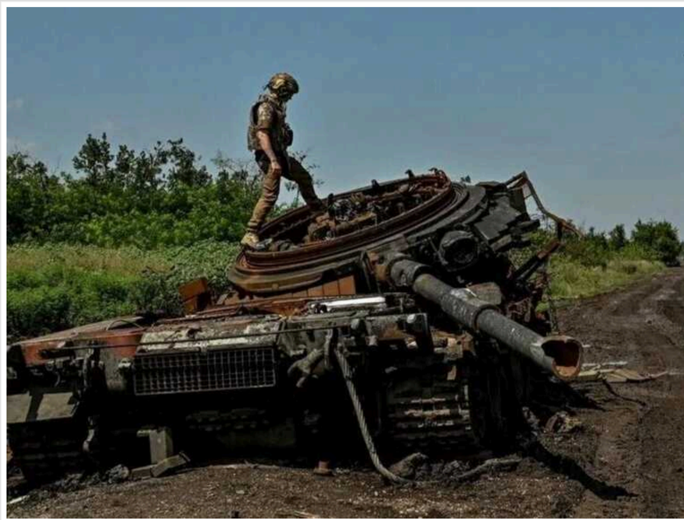
Втрати ворога за добу: «відмінували» 1090 окупантів та 27 артсистем

Протягом останньої доби Сили оборони України знищили на фронті 1090 російських окупантів. Загальний обсяг втрат Росії вбитими та пораненими за час повномасштабної війни досяг 611 190 осіб.