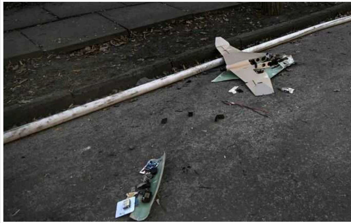
Окупанти атакували бригаду "швидкої", яка поспішала на допомогу пораненому у Херсоні

Сьогодні, 27 серпня, російські окупанти завдали удару по бригаді "швидкої" у Херсоні. Медики їхали на виклик після чергового обстрілу.