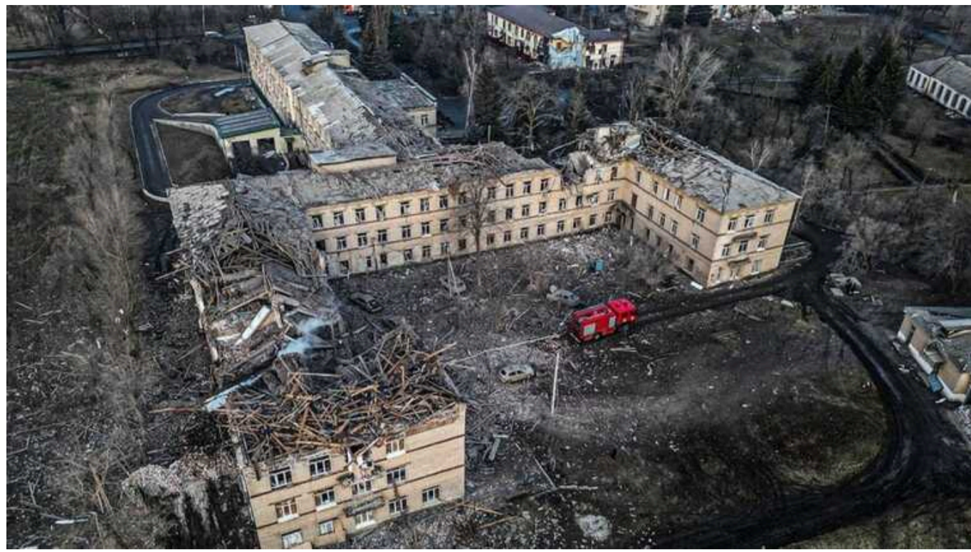
Окупанти продовжують руйнувати Селидове в Донецькій області

В інтернеті опублікували відео руйнувань у Селидовому Донецької області.