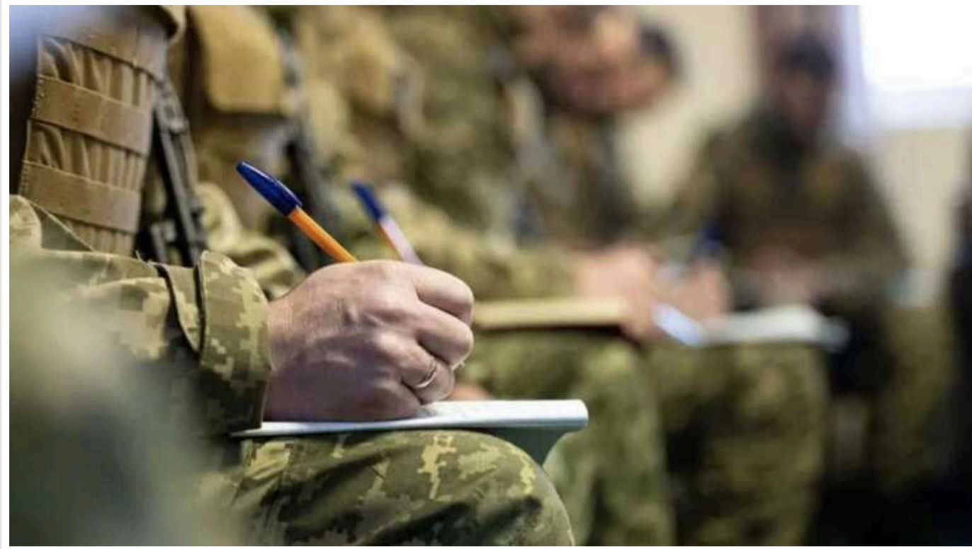
Трьох мобілізованих ексв'язнів після втечі повернули до військової частини на Одещині, - ОК «Південь»