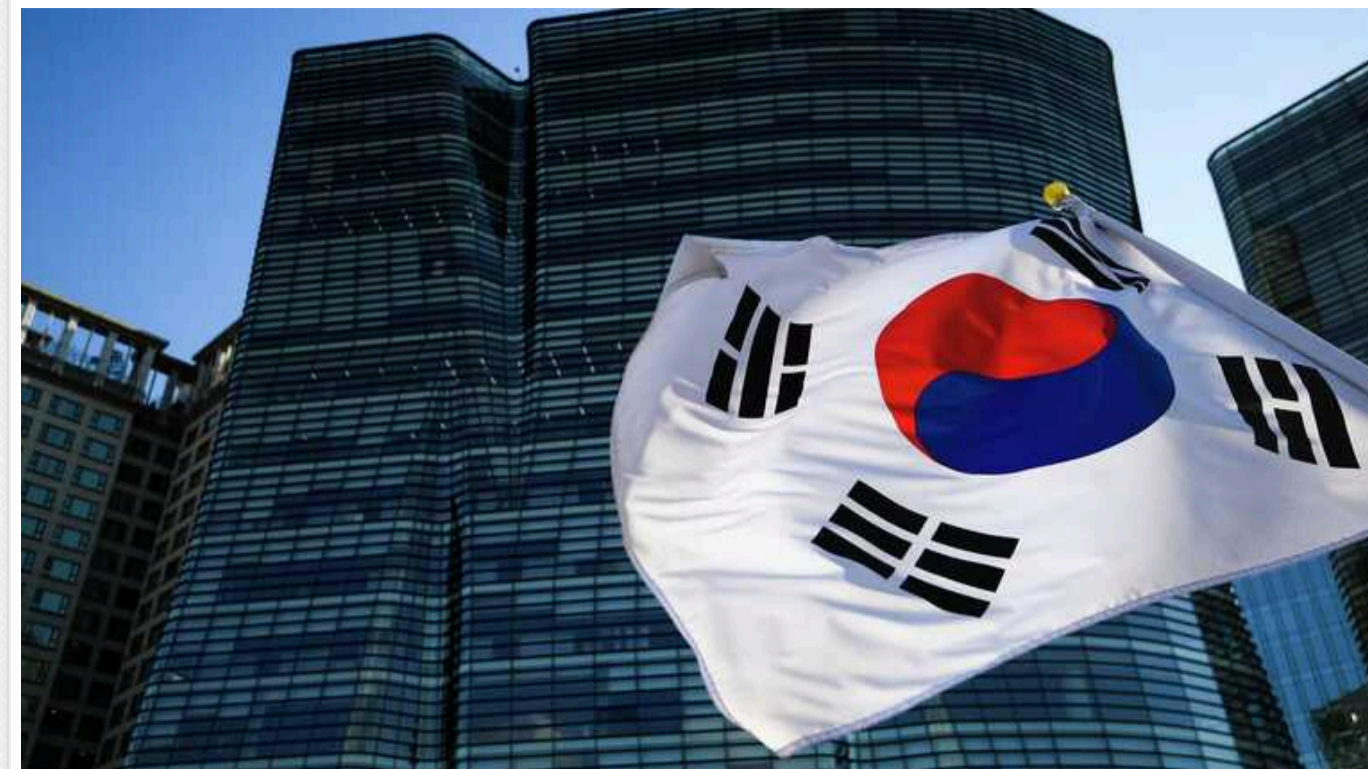
Південна Корея оголосила про претензії до Telegram

Президент Південної Кореї Юн Сук Йоль закликав до уважного розслідування злочинів сексуального характеру в цифровому середовищі після того, як місцеві ЗМІ повідомили, що в чатах Telegram часто зустрічаються фальшиві відверті зображення та відео за участю південнокорейських жінок.