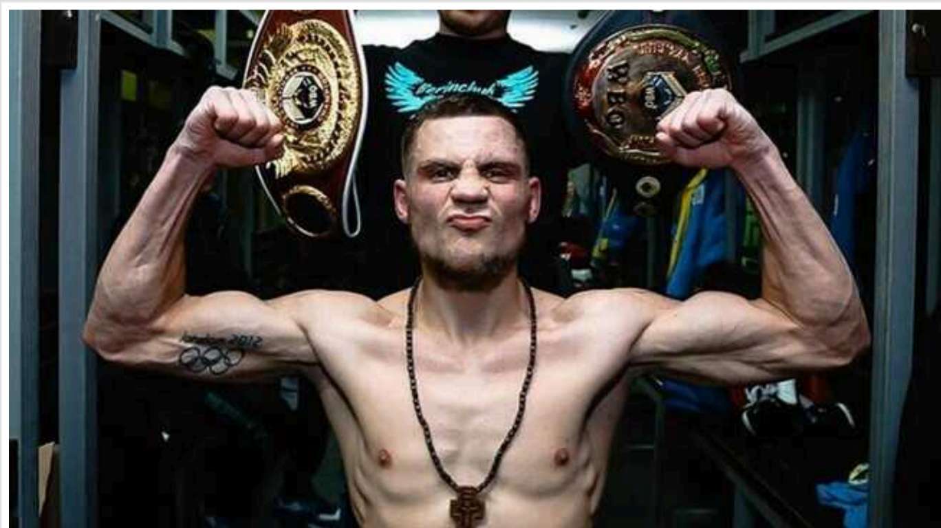
Чемпіон світу з боксу Берінчик із гармати підсмажив російських окупантів

Чемпіон світу у легкій вазі за версією WBO Денис Берінчик (19-0, 9 KO) похвалився своєю поїздкою на позиції українських військових на донецькому напрямку. У себе в Instagram 36-річний український боксер виклав відео, в якому стріляє по окупантах із артилерії.