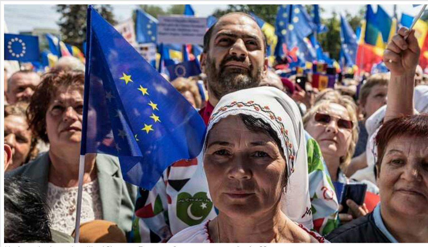
Молдовські олігархи Ілан Шор і В'ячеслав Платон саботують вступ країни до ЄС

Шанувальники «російського світу» Ілан Шор та В'ячеслав Платон дискредитують процес євроінтеграції у соціальних мережах.