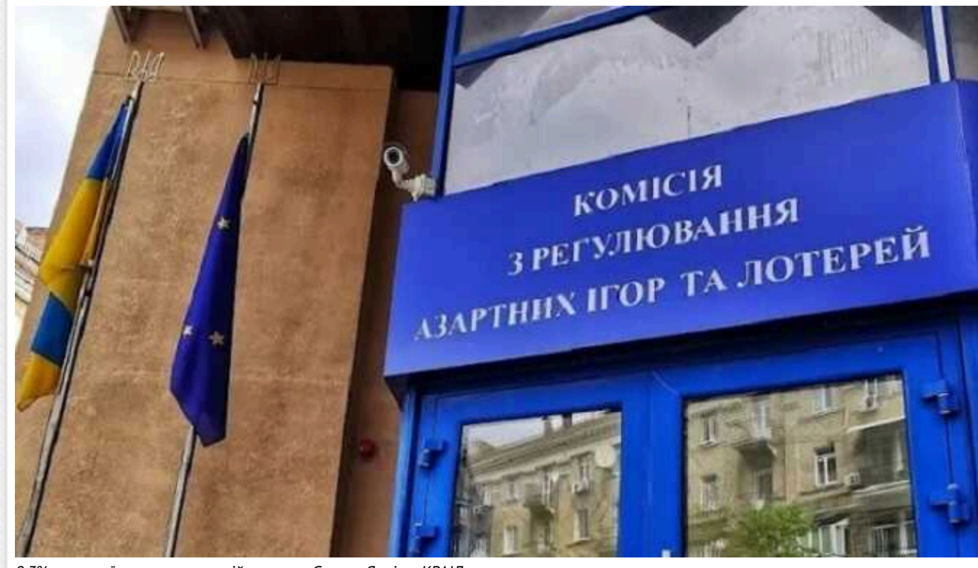
0,3% з кожної ставки: корупційна схема Євгена Яхнія у КРАІЛ

До вашої уваги традиційна рубрика «Вечірній КРАІЛ», у якій ми продовжуємо підшувати публічні сторінки кримінальної справи проти цього відверто злочинно-корупційного угруповання.