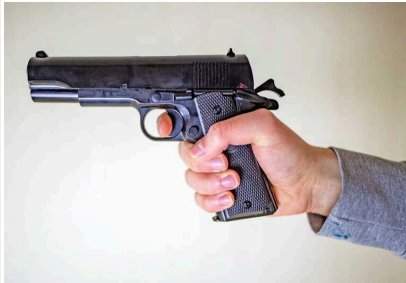
У Луцьку невідомий відкрив вогонь по військових на посту: є поранений

У ніч проти 27 серпня у Луцьку невідома особа вчинила стрілянину по військовослужбовцях на посту. Правоохоронці з'ясувають обставини події.