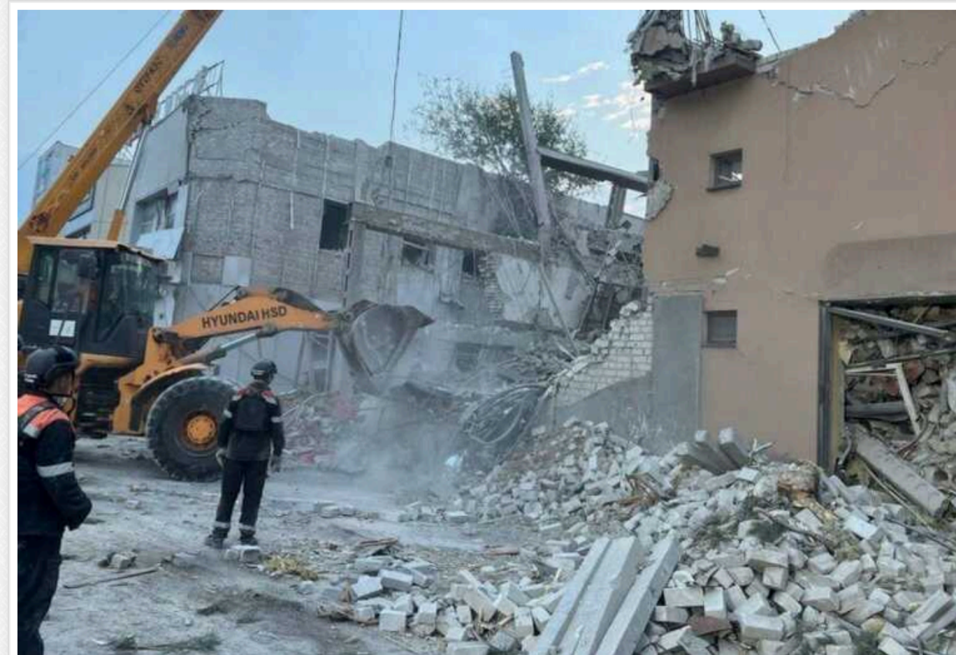
Нічна атака на Кривий Ріг: кількість жертв зросла

Унаслідок ракетного обстрілу готелю у Кривому Розі вже підтверджено трьох загиблих. Рятувальна операція триває.