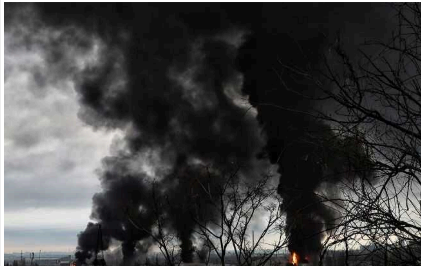
Нічна атака росіян на Запоріжжя: в мережі з'явилося відео прильоту

Поліція продемонструвала момент сильного удару по Запоріжжю.