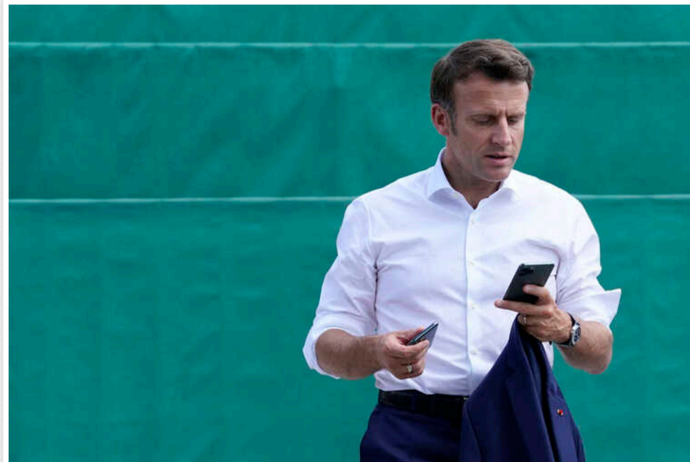
Макрон та вся політична еліта Франції активно користуються Telegram, - Politico

Влада надала Дурову французький паспорт. Але це не вберегло засновника Telegram від затримання в Парижі.