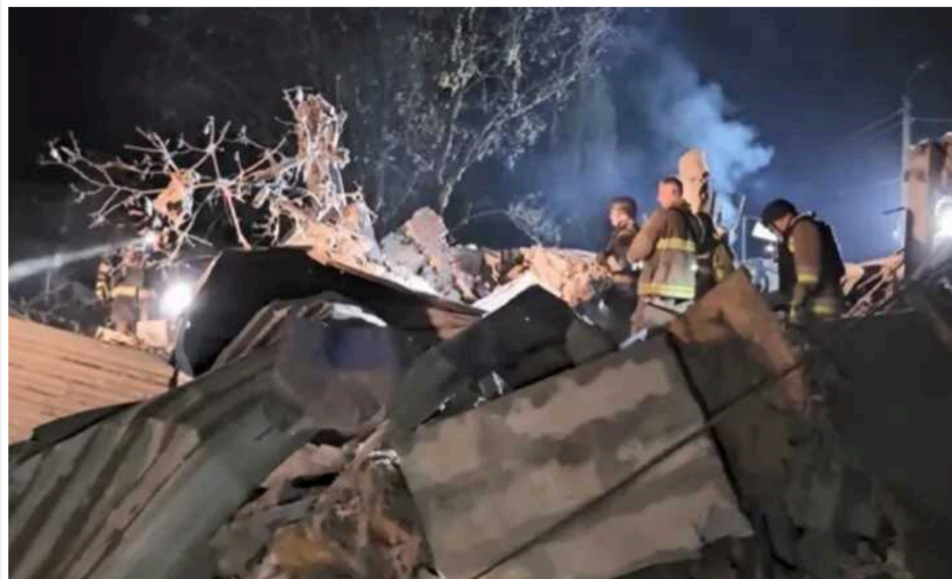
Російські пропагандисти зізналися, що РФ цілеспрямовано вдарила по журналістах Reuters у Краматорську

Увечері 24 серпня Росія завдала удару по готелю в Краматорську Донецької області: постраждали західні журналісти, один співробітник агентства Reuters загинув. Після цього російські пропагандисти визнали, що удар по цивільному об'єкту був завданий умисно.