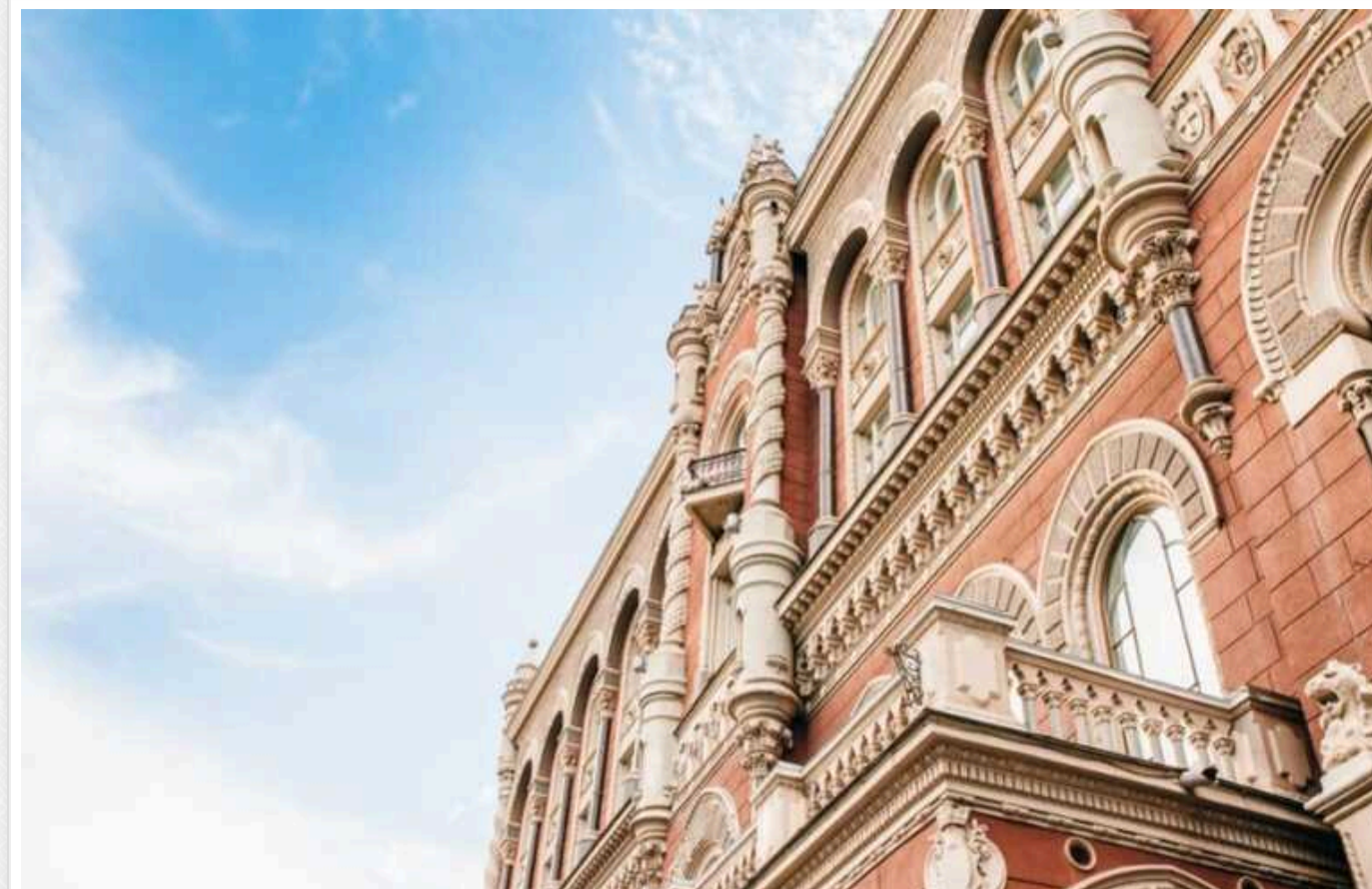
Нацбанк запроваджує тимчасовий ліміт на обсяг переказів з картки на картку

Національний банк України з 1 жовтня на пів року запроваджує обмеження на перекази з картки на картку для фізичних осіб.