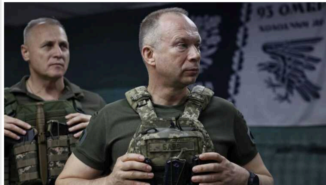
Ми контролюємо 100 населених пунктів на Курщині. В полон взято 594 окупанта, – Сирський

Наразі Росія перекинула майже 30 тисяч солдатів у Курську область з інших напрямків.