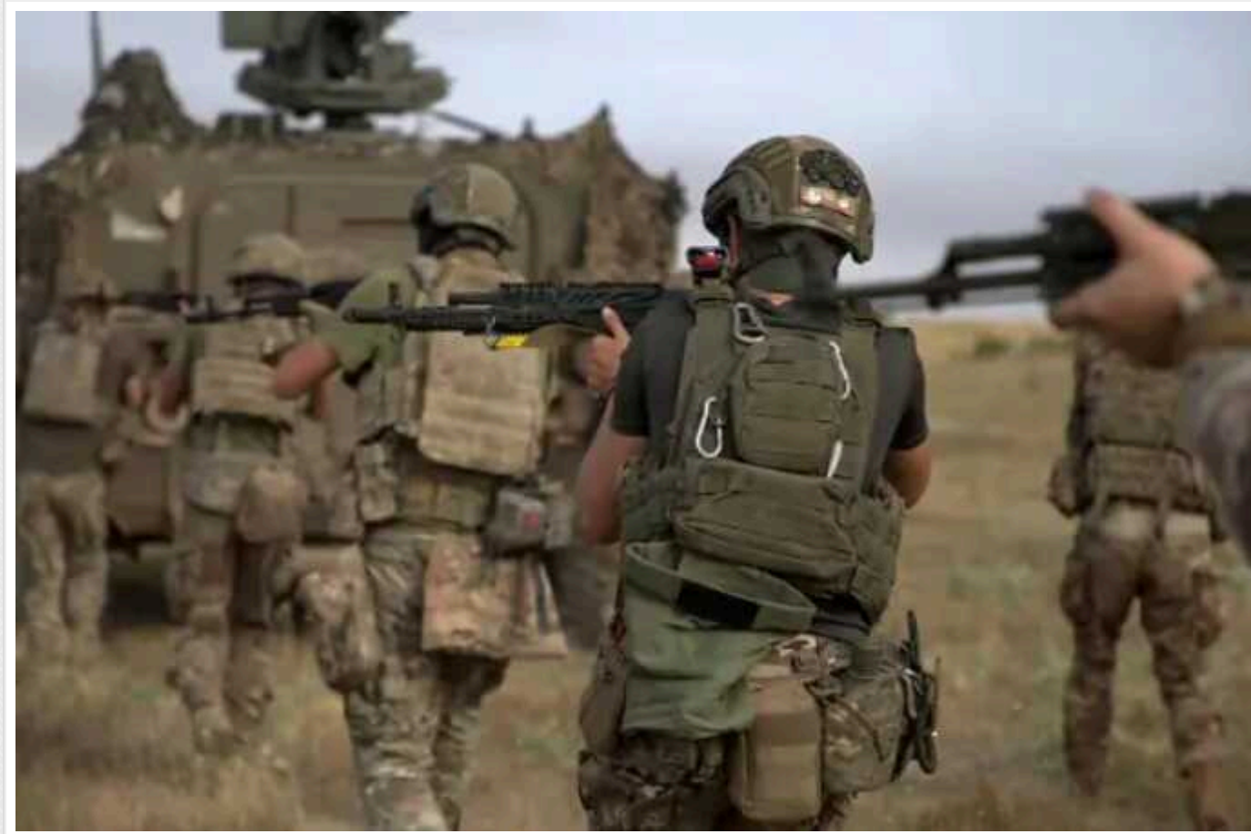
Годжес назвав прорив ЗСУ у Курську область «блискучим планом»

Командування Сил оборони України розпочало багатомісрну операцію, в рамках якої рейд у Курській області відбувається одночасно з ударами вглиб російської території, пояснив генерал Бен Годжес. Він вражений планом Генштабу ЗСУ і назвав його «блискучим».