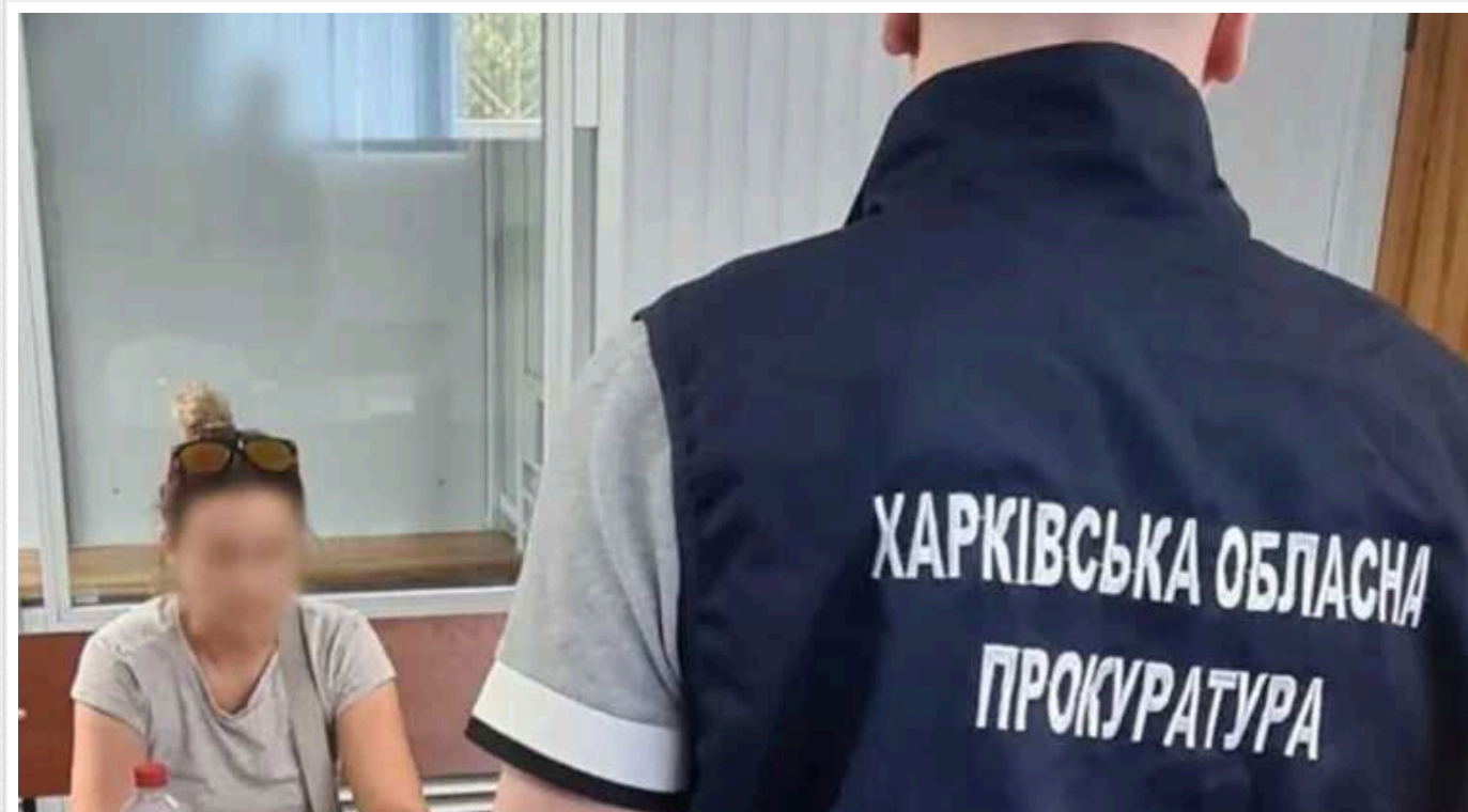
У Харківській області судитимуть російську інформаторку, яка передавала ворогу інформацію про місцезнаходження ЗСУ

На Харківщині затримали інформаторку, яка передавала російським окупантам інформацію про місцезнаходження українських військових. Ці дані були необхідні ворогу для послаблення оборони Харкова.