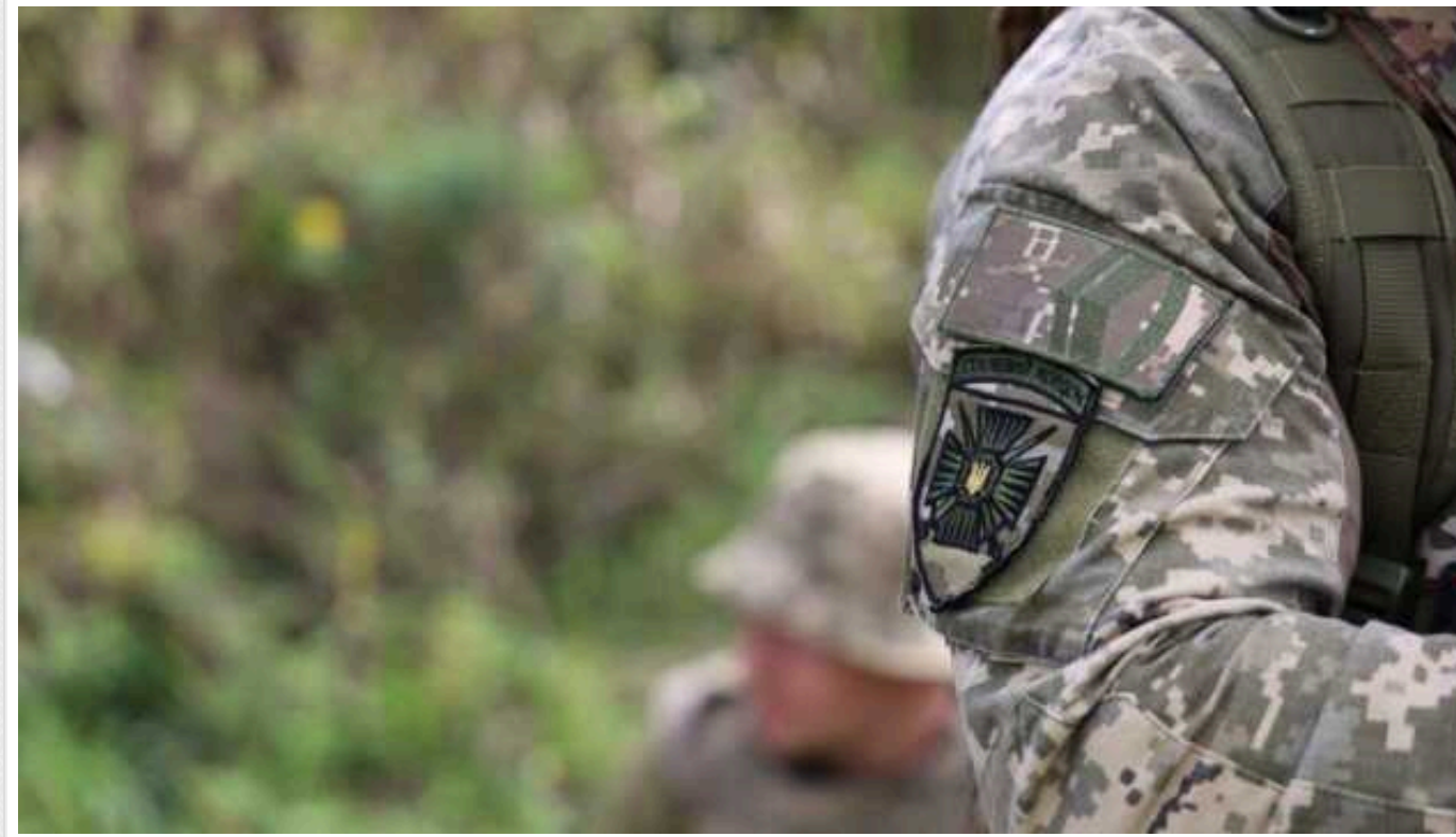
Прикордонники фіксують зниження активності російських диверсійно-розвідувальних груп

На українсько-російському кордоні спостерігається зниження активності російських диверсійно-розвідувальних груп.