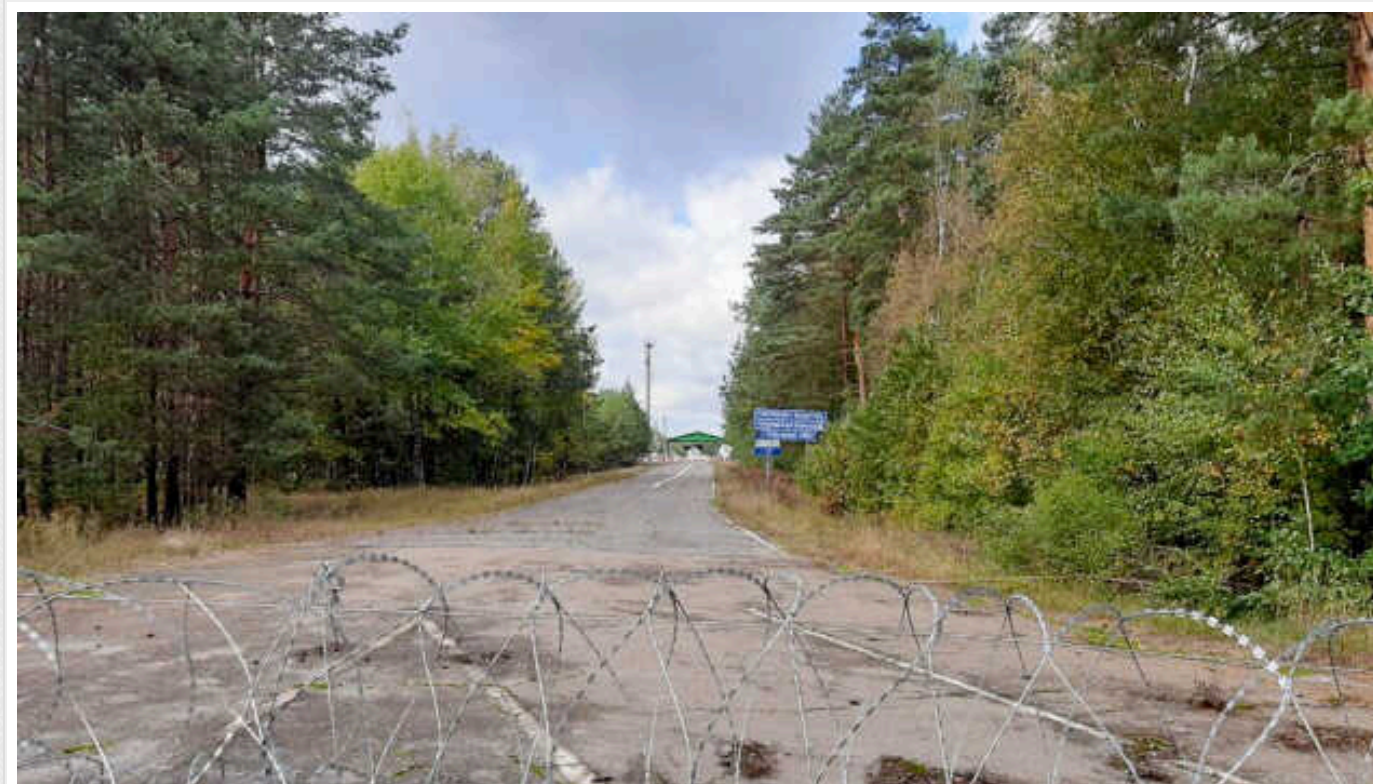
ДПСУ не зафіксувала пересування військ Білорусі поблизу кордону України

Державна прикордонна служба України наразі не фіксує переміщення техніки чи особового складу армії Білорусі у безпосередній близькості до українського кордону.