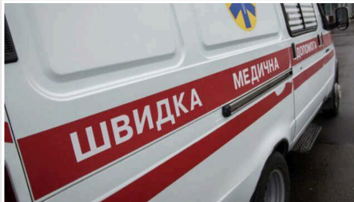
Окупанти завдали удару по Богодухову на Харківщині: троє поранених

Війська РФ вранці 27 серпня здійснили обстріл Богодухова на Харківщині, троє осіб отримали поранення.