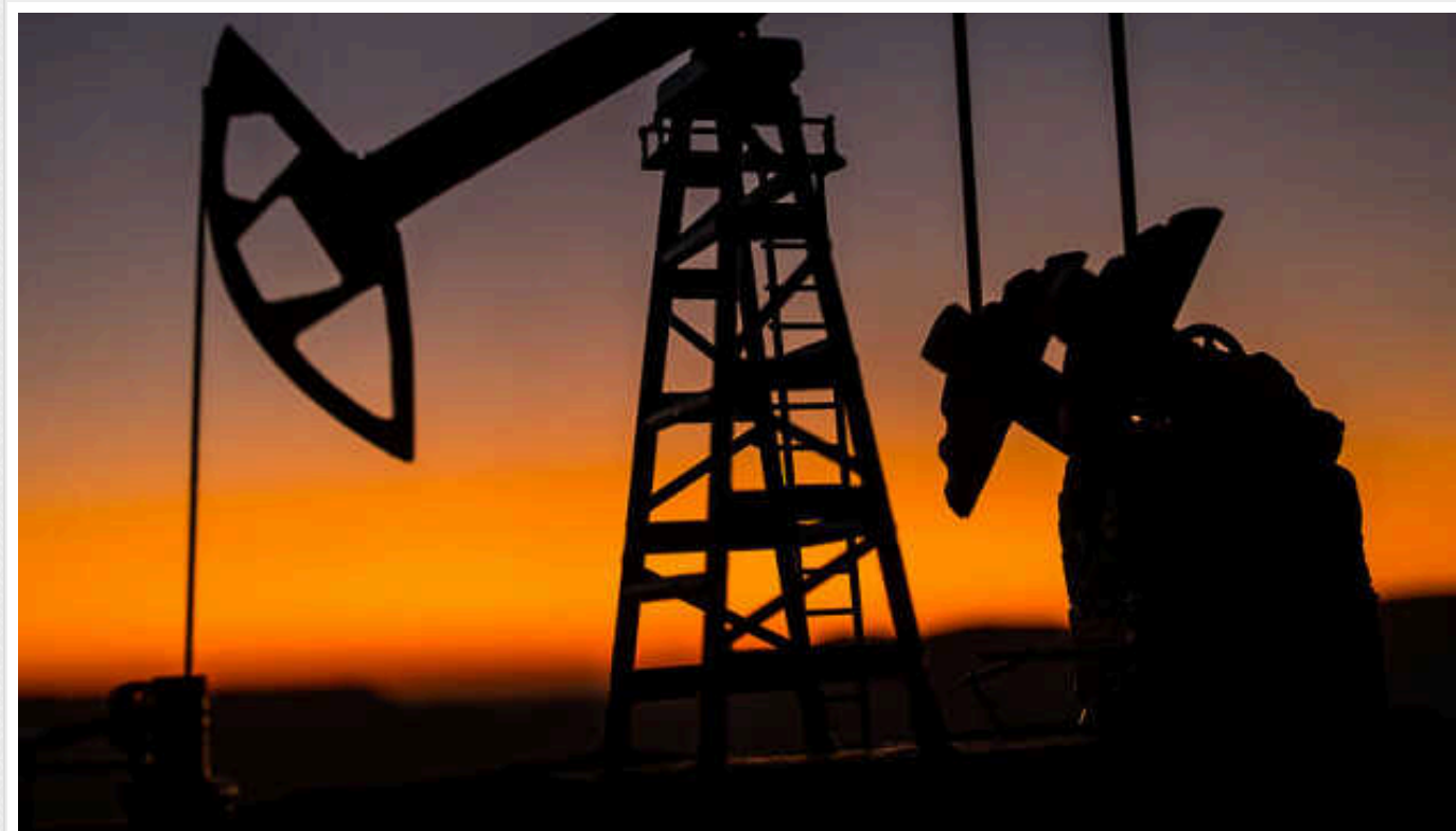
Нафта зупинила свій ріст цін після перебоїв у постачаннях в Лівії, – Reuters

Ціни на нафту зупинили своє нещодавнє зростання, знизившись у вівторок після підвищення більш ніж на 7% за попередні три сесії через побоювання щодо можливого закриття лівійських нафтових родовищ.