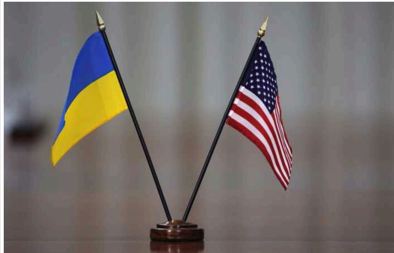
Politico: Україна надасть США список цілей у РФ, які можна атакувати американською далекобійною зброєю

Україна готується надати адміністрації президента США Джо Байдена список цілей в Росії, які можна атакувати, якщо Вашингтон зніме обмеження на використання американської далекобійної зброї.