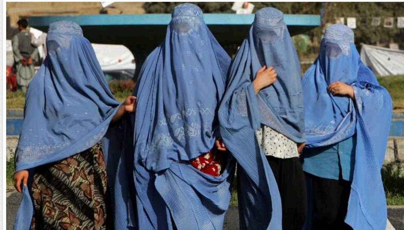
Європейський Союз засудив нові обмеження «Талібану» для жінок в Афганістані

Європейський Союз нещодавно засудив нові заборони "Талібану" для жінок, які були запроваджені законом "щодо поширення чесноти і запобігання порокам".