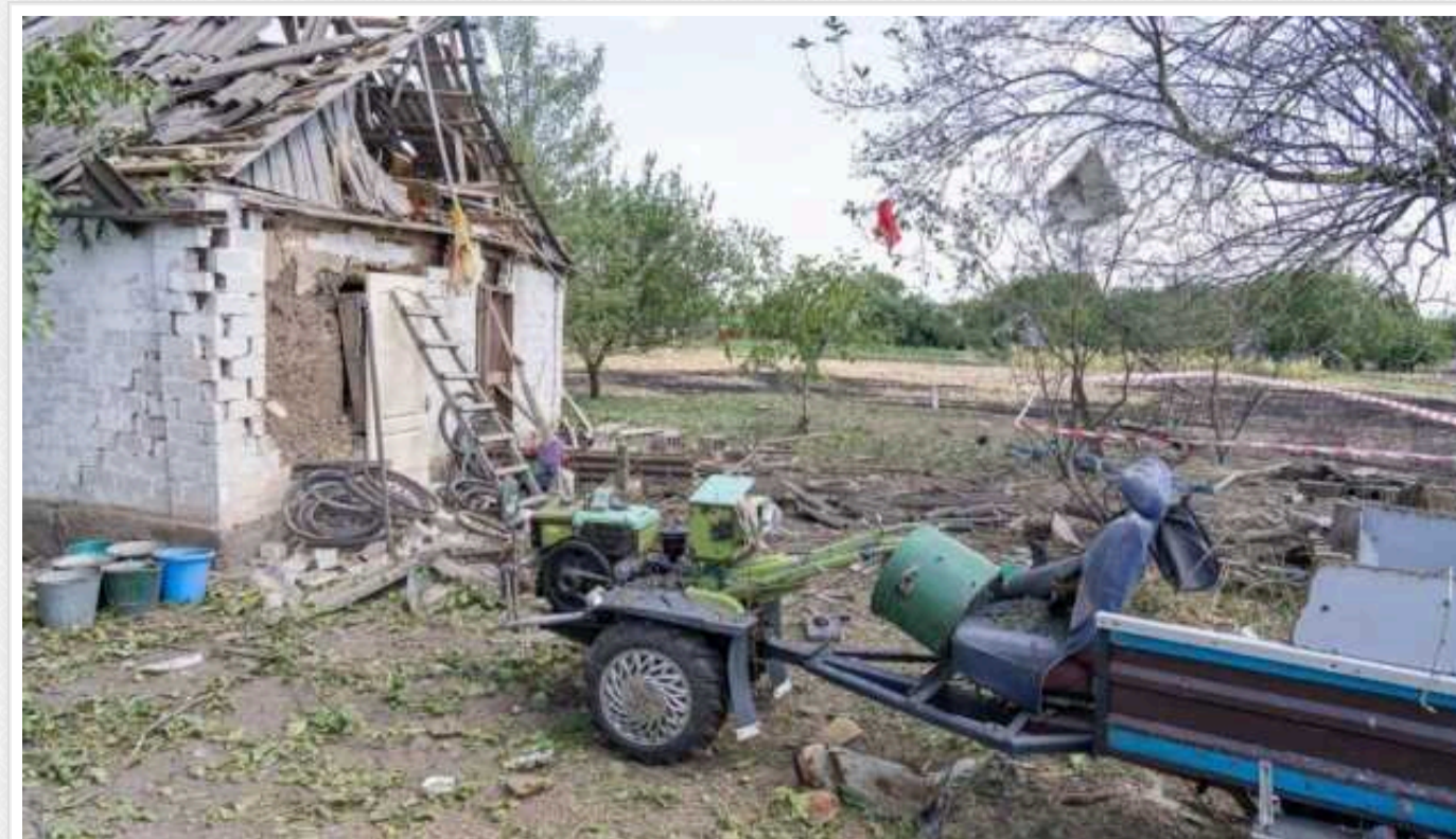
Окупанти протягом доби здійснили 208 атак на Запорізьку область, є загиблі та поранені

Протягом доби в Запоріжжі та Запорізькому районі внаслідок ворожих атак загинуло троє людей, ще п'ятеро отримали поранення.