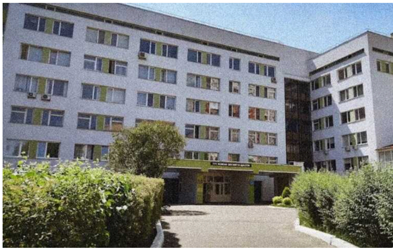
Столичний пологовий будинок платив зарплату 17 неіснуючим працівникам

Дніпровський районний суд ухвалив вирок двом працівницям Київського пологового будинку №6, які були причетні до корупційної схеми з привласнення державних коштів. У рамках цієї схеми пологовий будинок протягом більше ніж року сплачував зарплати 17 вигаданим працівникам медичного закладу. Ці особи отримували премії та оплачувані відпустки, однак ніколи не з'являлися на робочому місці. У результаті держава зазнала збитків у розмірі 4,5 млн грн.