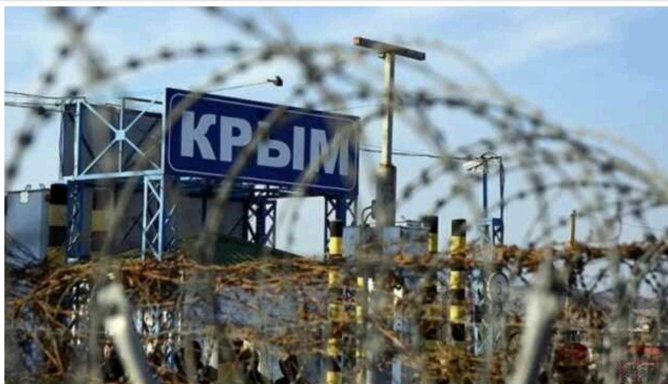
В окупованому Криму через успішні атаки ЗСУ росіяни посилили перевірки населення, – ЦНС

На території тимчасово окупованого Криму російські військові посилили контроль за населенням після успішних атак ЗСУ на інфраструктуру півострова.