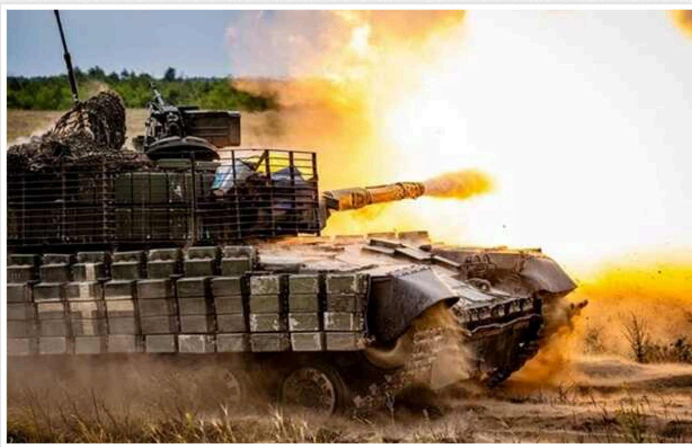
DeepState підтверджує інформацію про суттєве просування ворога на Донеччині

За повідомленнями військових аналітиків, російські війська окупували Птиче, а також просунулися в районі Піщаного, Калинового, Карлівки, Мемрики, Красног Яру, Михайлівки, Північного, Новгородівки та околиць.