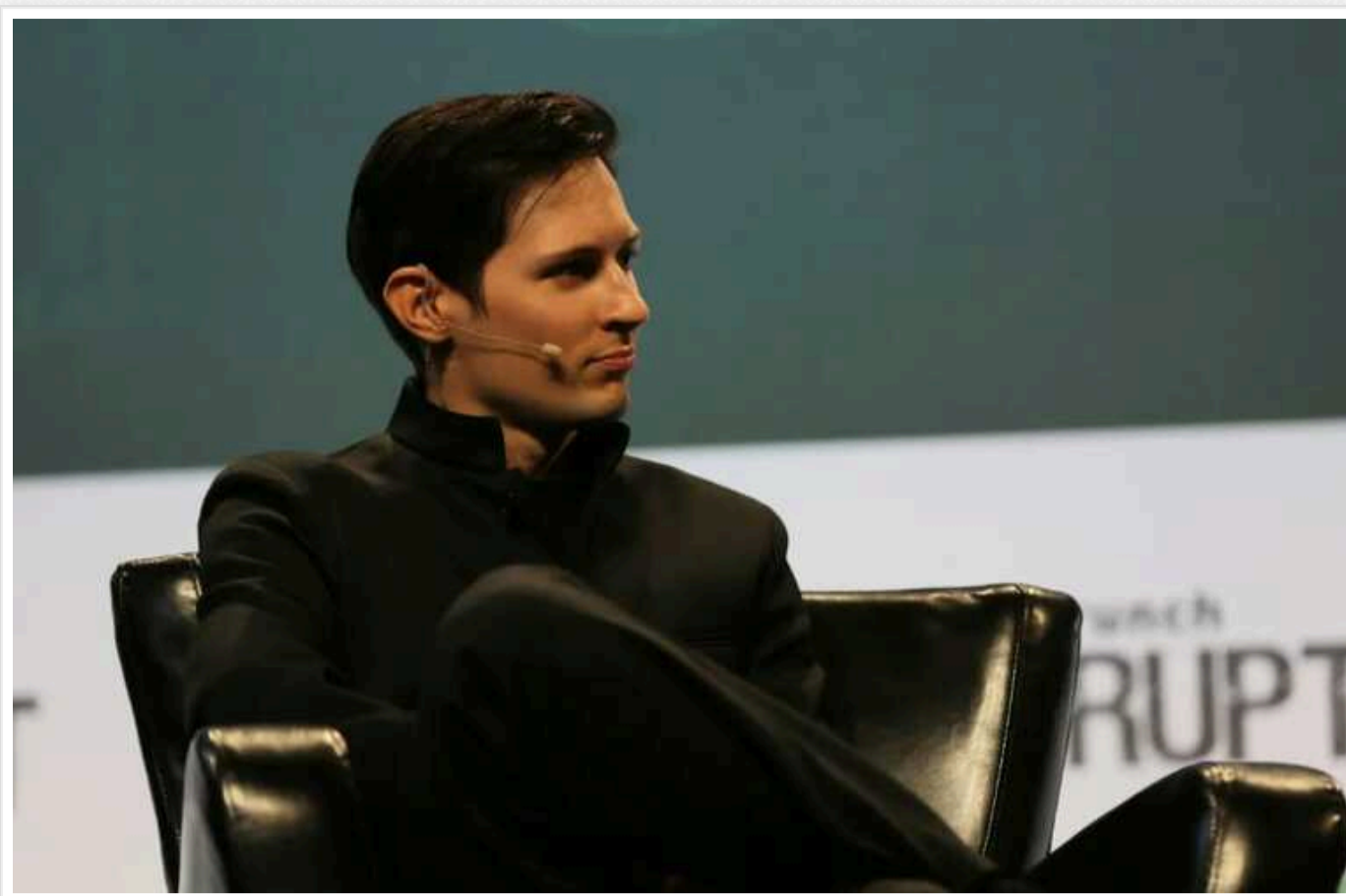
У Франції Telegram став найзавантаженим додатком у категорії «Соцмережі»

Про це повідомляє видання Techgripch, посилаючись на дані сервісу Appfigures.