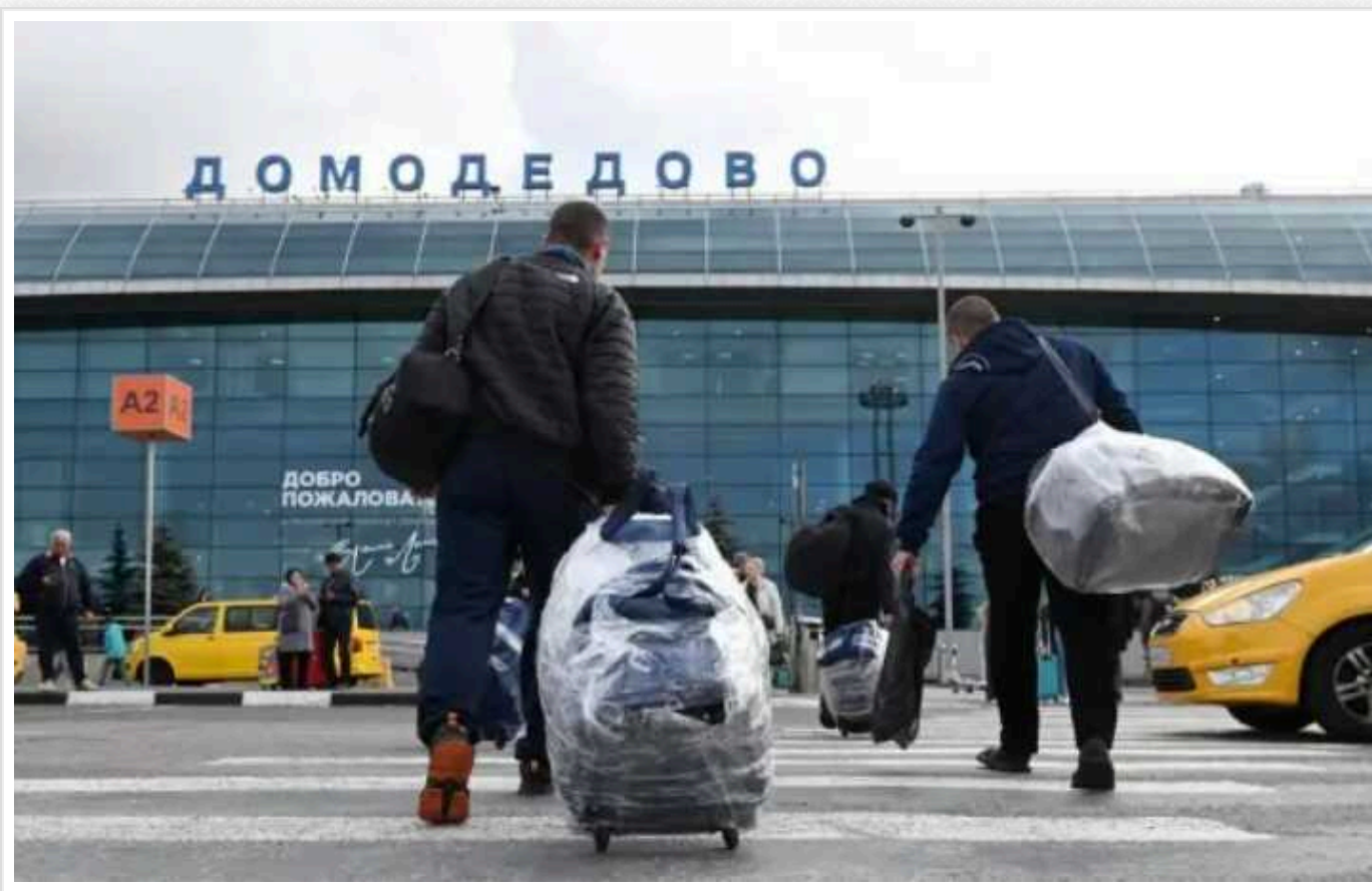
У мережу "витекла" база даних ФСБ про росіян, які залишили країну з 2014 року