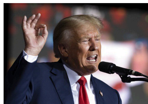
Лікарі поставили Трампу діагноз: світ в паніці