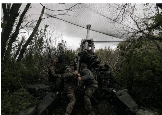
Під Покровськом росіяни намагаються прорвати оборону ЗСУ