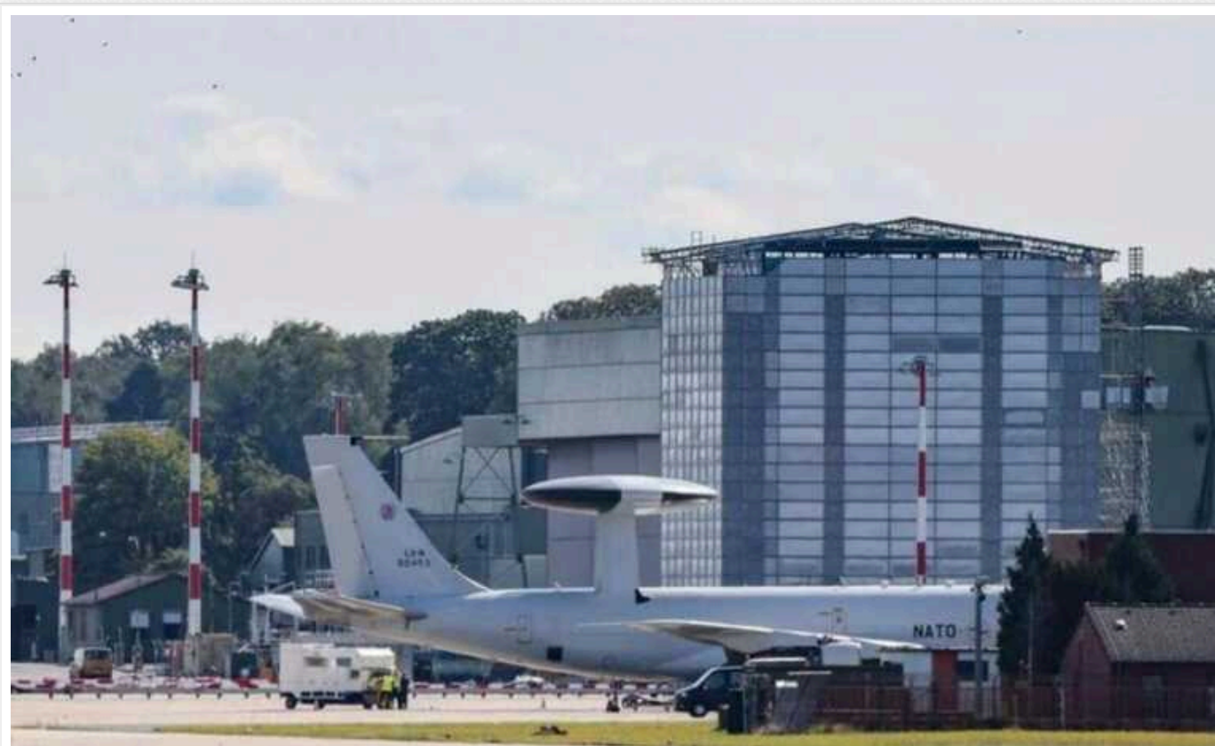
Росія могла готувати диверсію на базі НАТО в Німеччині, - DPA

Посилення заходів безпеки на базі ВПС НАТО в Гайленкірхені (західна Німеччина), проведене минулого тижня, стало результатом інформації від розвідки про потенційну загрозу диверсії, ймовірно з боку Росії, повідомляє видання, посилаючись на джерела в німецьких органах безпеки.