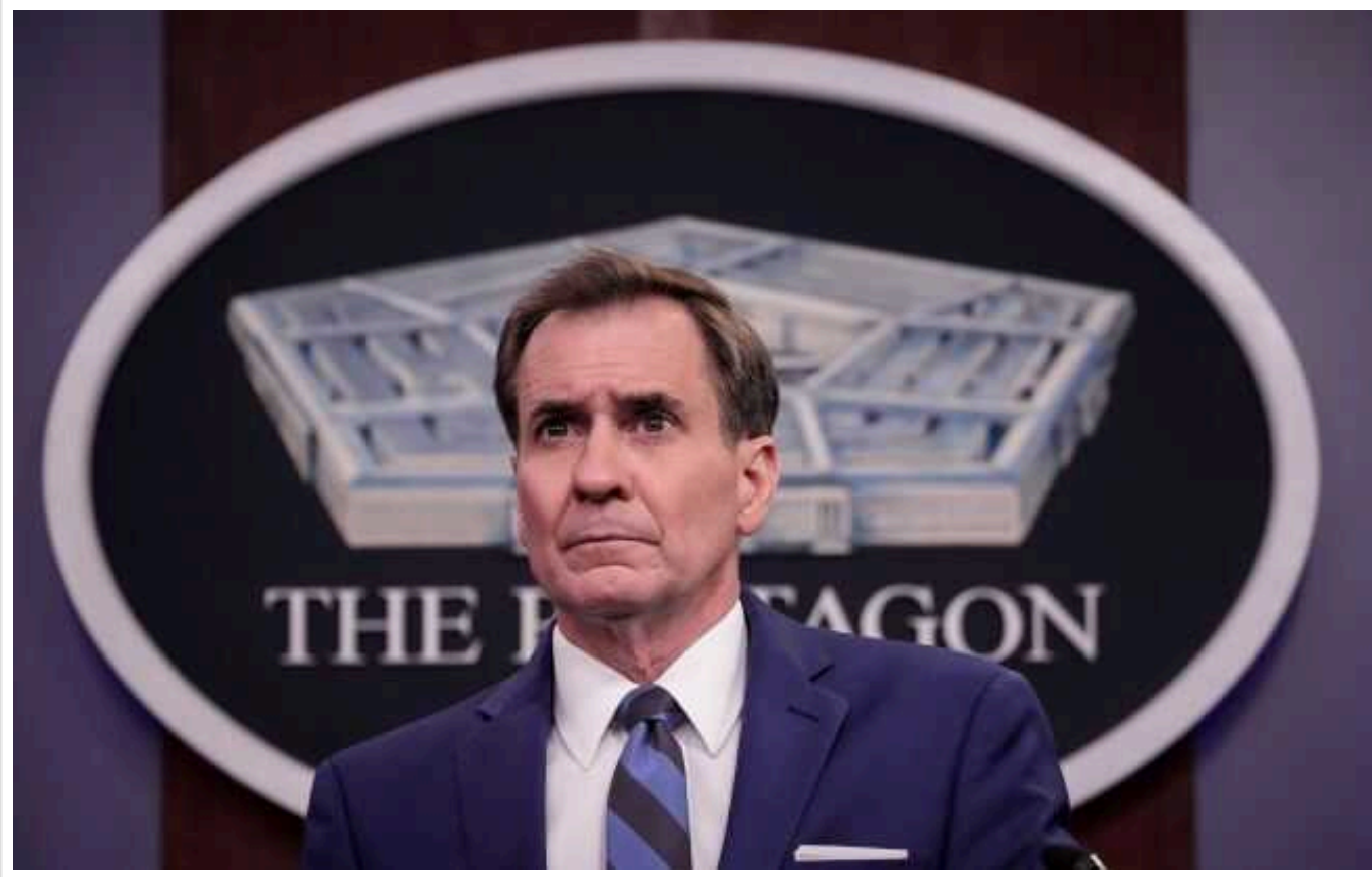
У США відреагували на заклик Зеленського зняти обмеження на удари по РФ

Сполучені Штати Америки продовжать вести переговори з Україною щодо зняття обмежень на далекобійні удари по Росії. Діалог проходитиме в непублічному форматі.