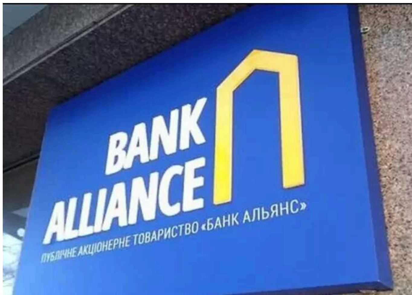
Гроші на ремонті після обстрілів: як борг банку «Альянс» може допомогти «Укренерго» відновити інфраструктуру

Відновлення відключень електроенергії, які відбуваються через сьогоднішню чергову російську атаку на енергооб'єкти, ще раз підкреслює потребу НЕК "Укренерго" в додатковому фінансуванні ремонтів та підтримання в належному стані інфраструктури. Тому затягування судового процесу зі стягнення боргу в 1,2 млрд грн з банку "Альянс" прямо шкодить цьому інтересу.