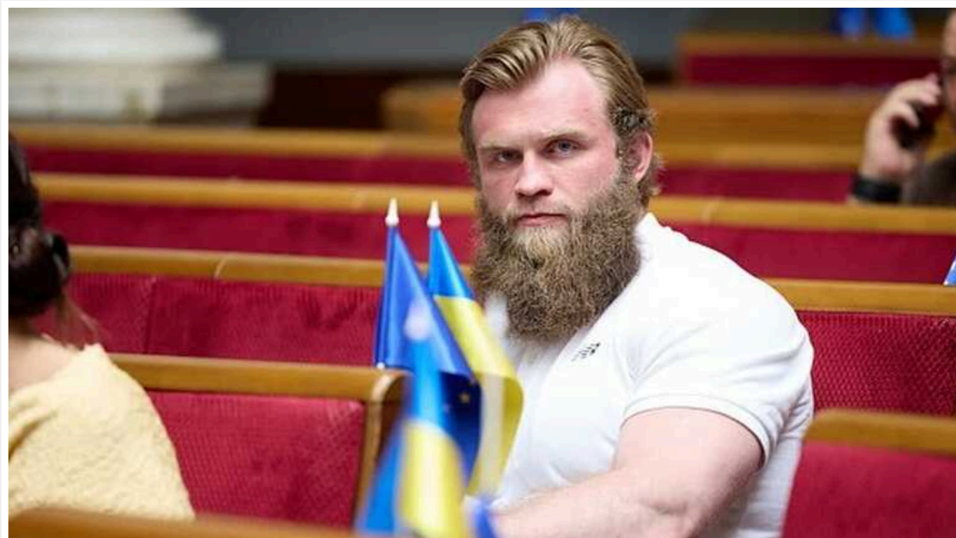
Втеча депутата Артема Дмитрука

24 серпня о 12 годині народний депутат України Артем Дмитрук пішки перетнув кордон з Молдовою через пункт пропуску "Паланка".