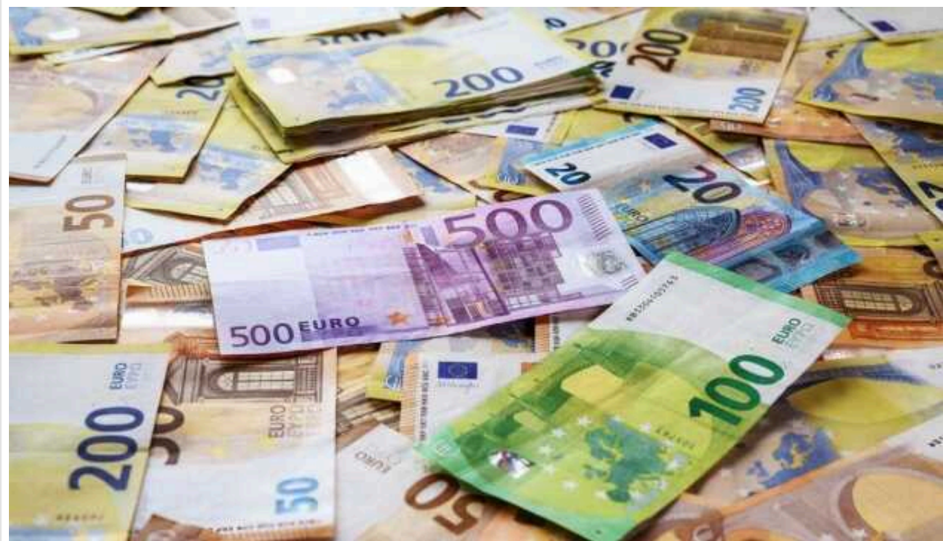
Курс євро досягнув найвищого рівня відносно долара за останні 13 місяців