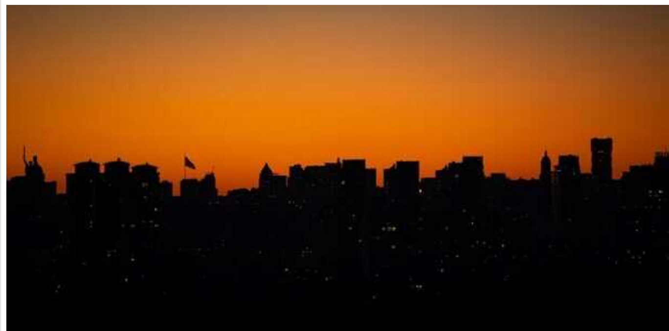
Путін хоче розбомбити Україну, щоб занурити її в повний блекаут, – WELT

Тактика російських загарбників залишається незмінною вже понад два роки, зазначають журналісти. Противник завдає ударів по енергетичній інфраструктурі, орієнтуючись на виснаження України. У зв'язку з цим союзникам слід переглянути свою позицію щодо обмежень для України.