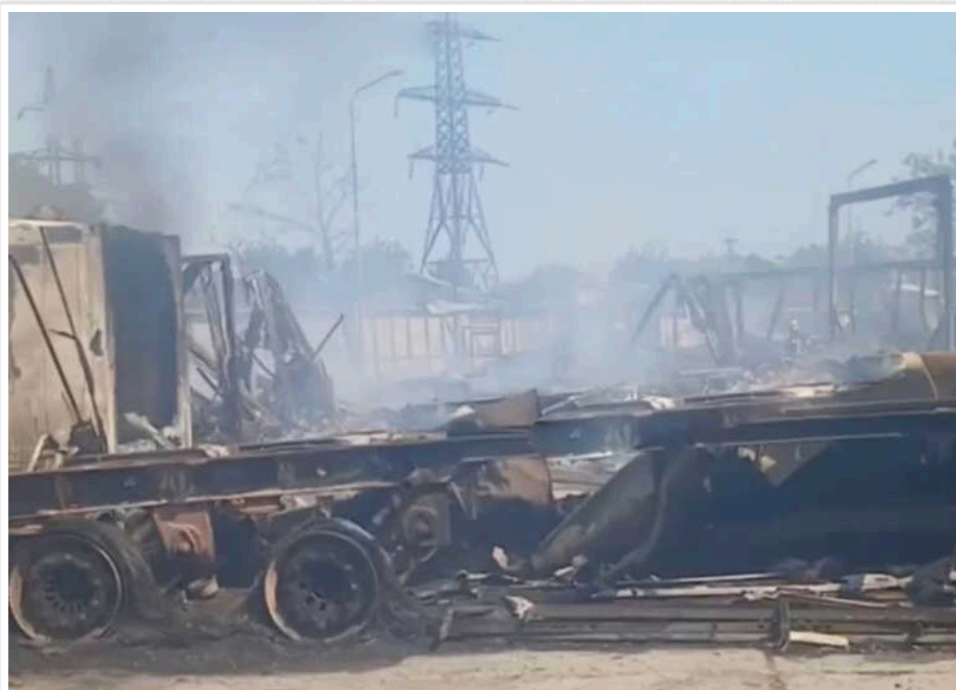
В Одесі внаслідок атаки РФ згоріло близько 40 вантажних авто

Близько 40 вантажівок згоріло сьогодні внаслідок ракетних ударів по Одесі.