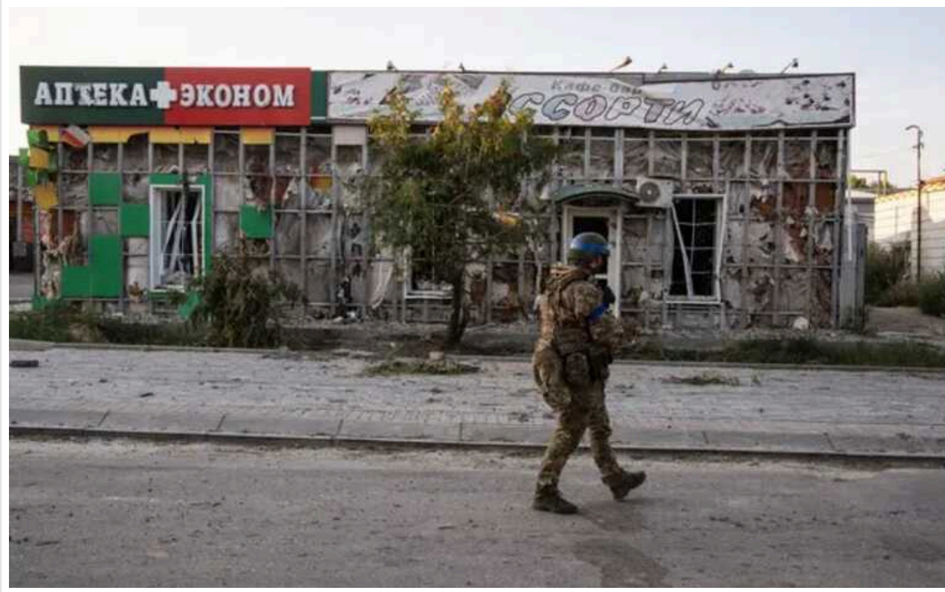
Після прориву в Курську область Україна перетнула "червоні лінії" не лише Росії, а й США, - ЗМІ