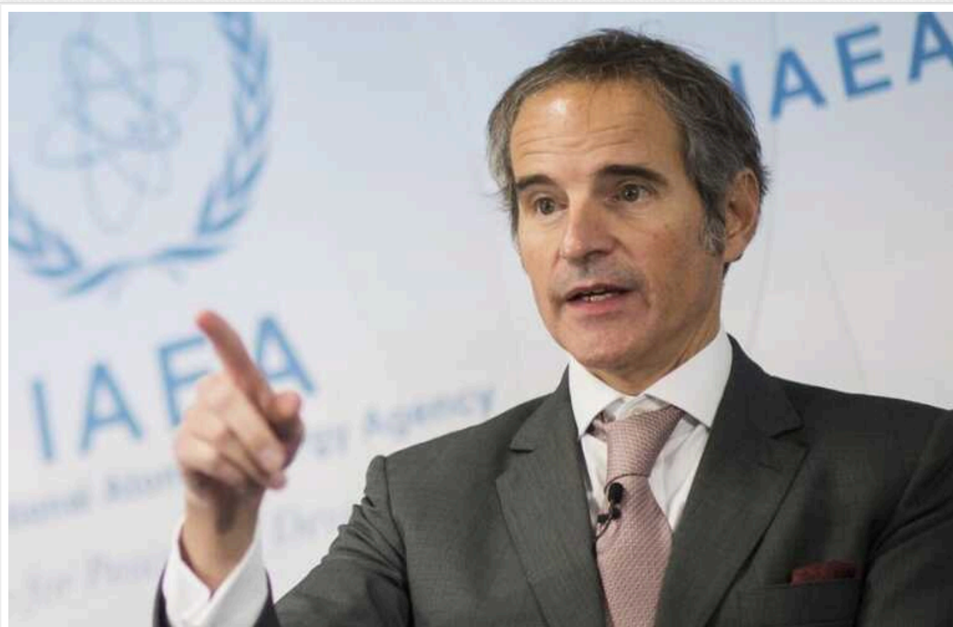
Гроссі анонсував візит на Курську АЕС

Генеральний директор МАГАТЄ Рафаель Гроссі у вівторок, 27 серпня, завітає до Курської атомної електростанції.