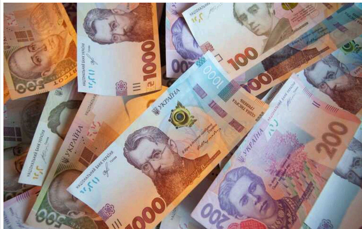
За сім місяців Україна вклала у безпеку та оборону 1 трильйон гривень

У січні-липні 2024 року з державного бюджету на сектор безпеки та оборони було виділено 1 трлн грн, зокрема у липні – 161,6 млрд грн.