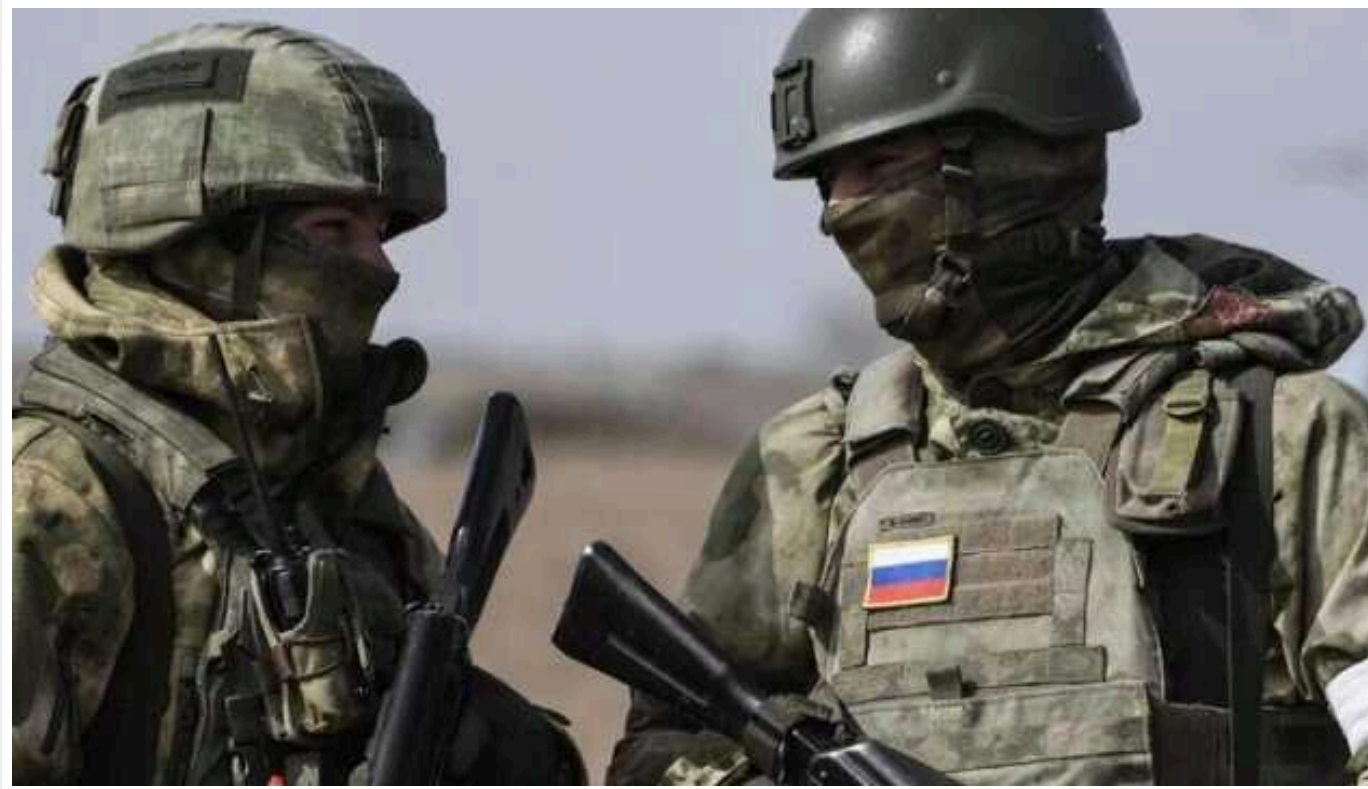
Росія продовжує впевнено підступати до Покровська, «ігноруючи» Курський наступ Збройних сил України