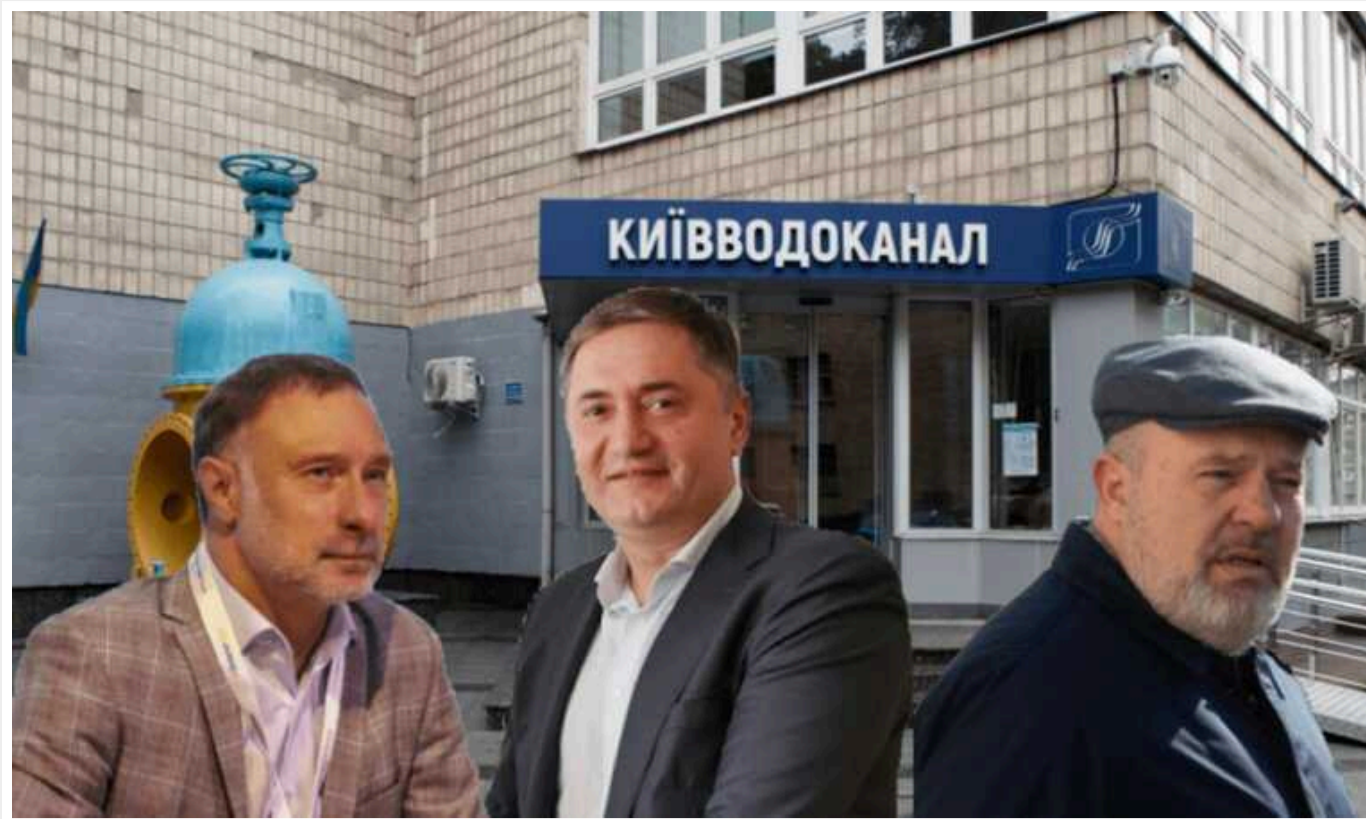
У київській мерії відзвітували про результати аудиту ПраТ «АК «Київводоканал»

Аудитори КМДА підсумували результати позапланової перевірки діяльності ПраТ "АК "Київводоканал" за період з 2019 по 2023 роки.