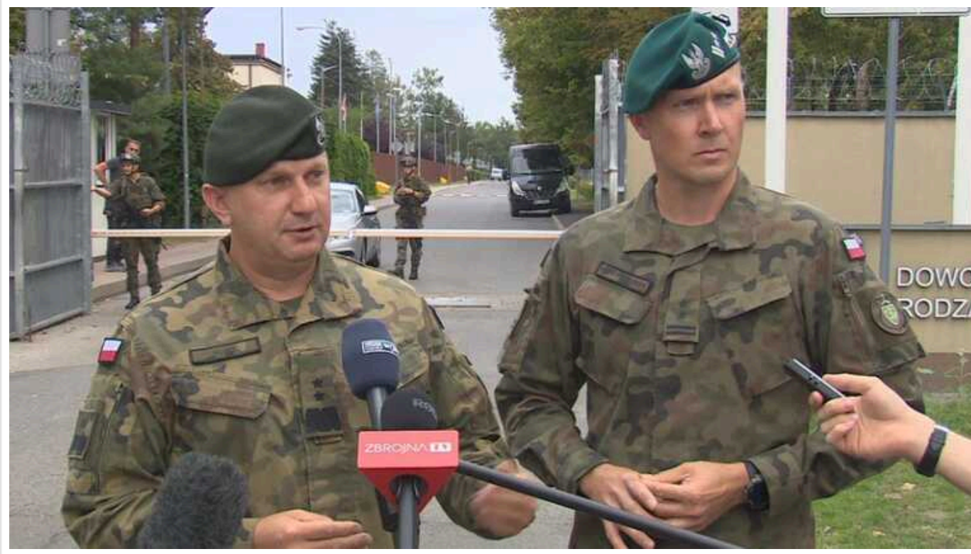
У Польщі назвали причини, через які вони не збили «повітряний об'єкт», що залетів з України

У Польщі повідомили, що не змогли знищити "повітряний об'єкт", який вторгся з території України під час масованої ракетної атаки, через атмосферні умови.