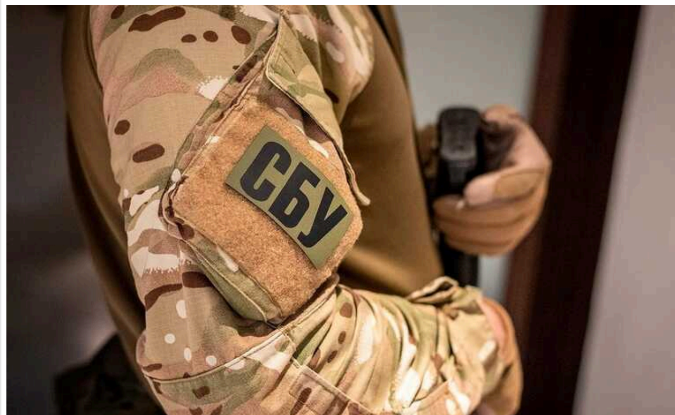
СБУ ідентифікувала трьох загарбників, які мають відношення до викрадення священників у Бердянську

Служба безпеки України повідомила ще трьом громадянам Росії про підозри в порушенні законів і звичаїв війни на території тимчасово окупованого міста Бердянська Запорізької області.