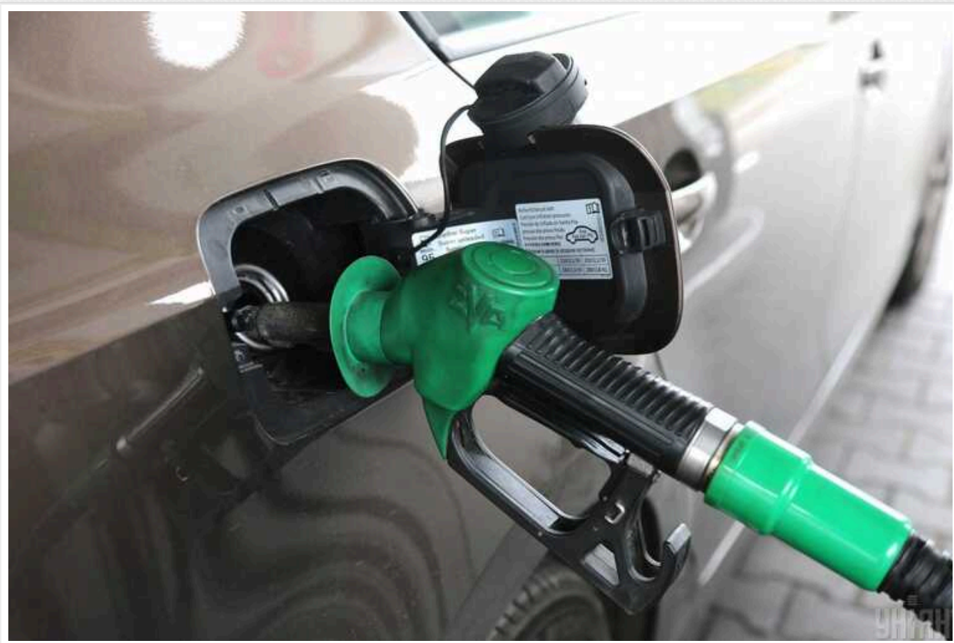
В Україні не буде різкого підвищення цін на бензин

В Україні з підвищенням акцизів на пальне, яке почнеться 1 вересня 2024 року, не планується різкого зростання цін на бензин та дизельне пальне. Такий висновок зробив експерт ринку пального Дмитро Льюшкін.