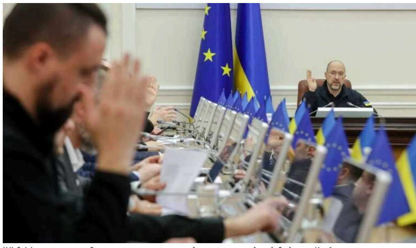
У Кабміні уточнили, кого забезпечать протигазами на випадок застосування ядерної зброї проти України

Кабінет Міністрів 16 серпня затвердив постанову № 936 щодо забезпечення населення протигазами на випадок застосування ядерної зброї чи іншої зброї масового ураження проти України.