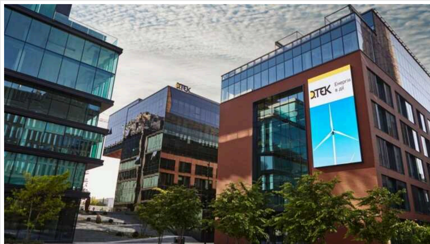
ДТЕК розширює портфель відновлюваної енергетики в Румунії: буде новий сонячний парк потужністю 60 МВт

ДТЕК розширює портфель відновлювальної енергетики в Румунії та буде новий сонячний парк потужністю 60 МВт в повіті Муреш, Румунія. Це четвертий проєкт ДТЕК у сфері відновлювальної енергетики в Румунії. Всього ДТЕК вже має там 299 МВт.