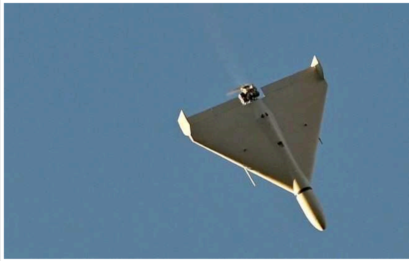
У Житомирській області внаслідок російського обстрілу загинула жінка

Пошкоджено житлові будинки та об'єкти критичної інфраструктури.